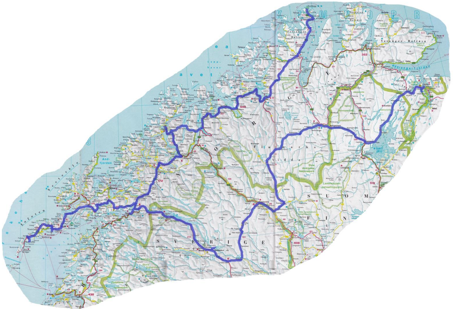
Vores rute tegnet med blåt.